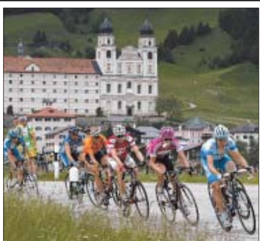
Der Tour-Tross passiert Disentis. (Ky)